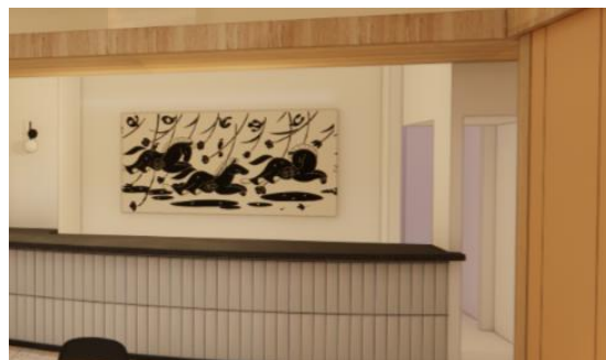
ゲストを迎えるフロントイメージ