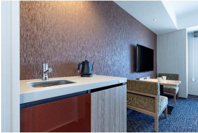
簡単な調理もできるミニキッチン