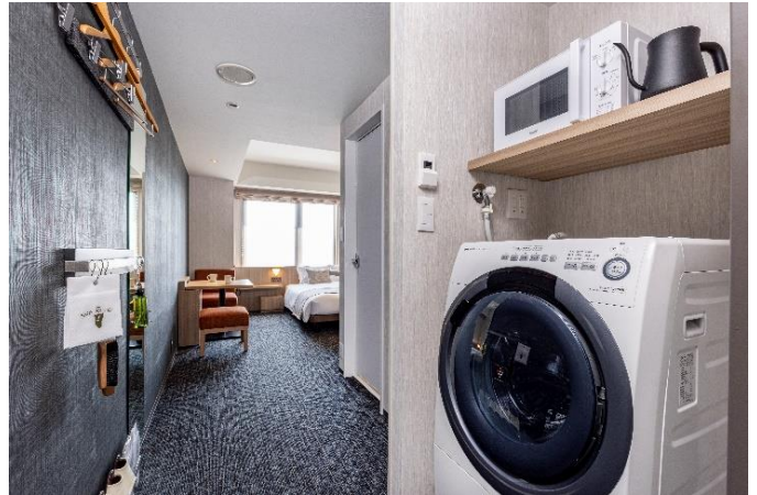
全室に備え付けの洗濯乾燥機と電子レンジ