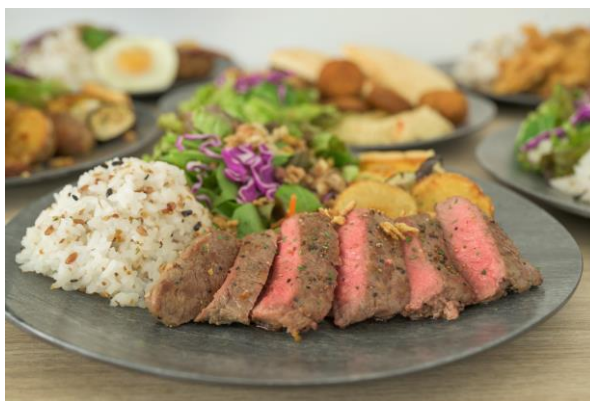
レストラン「sanshoku」料理イメージ