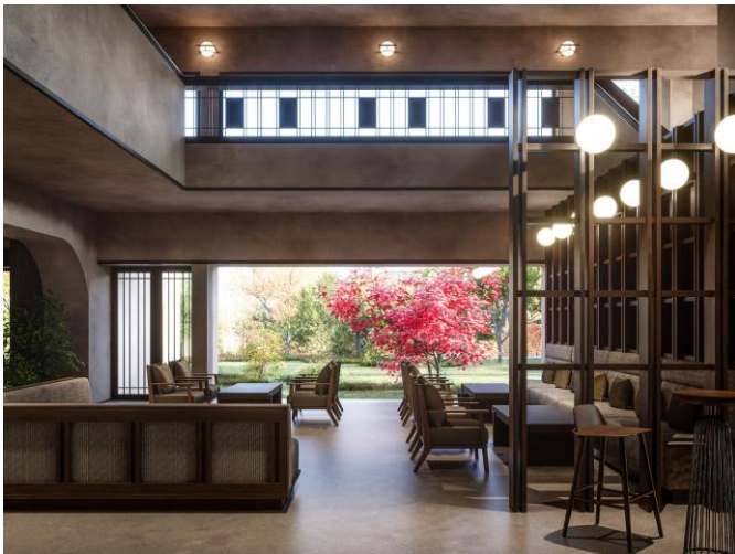
ロビーラウンジイメージ

本ホテルの前身「東急ハーヴェストクラブ箱根明神平」は、「東急箱根明神平別荘地（サニーパーク）」の中央に位置する会員制ホテルとして、長く会員の皆様にご愛顧いただきました。会員制ホテルとして満期を迎えるとともに改装を実施し、解放感あるエントランスロビーはそのままに、素朴で優しい風合いで設えたデザイン空間にリニューアルしました。森に囲まれたくつろぎを建物内でも感じていただき、雄大な山々を眺める中庭とともに、やすらぎのひと時をお楽しみいただけます。