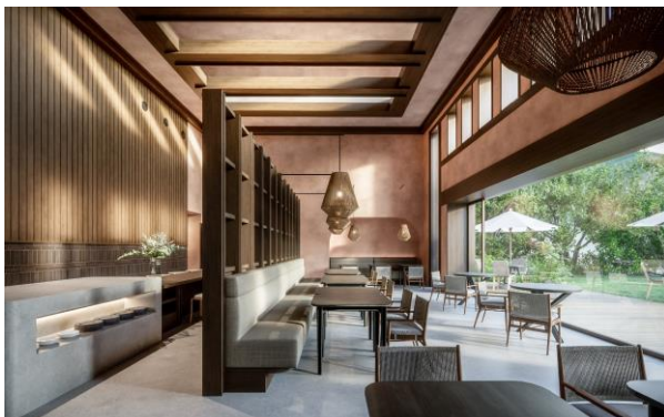
レストランイメージ

地元食材を中心に使用した健康志向のイタリアンレストラン。お客様の心と身体を整えるをコンセプトに地元野菜を多用したシェフ自慢のスペシャリテをお楽しみいただけます。