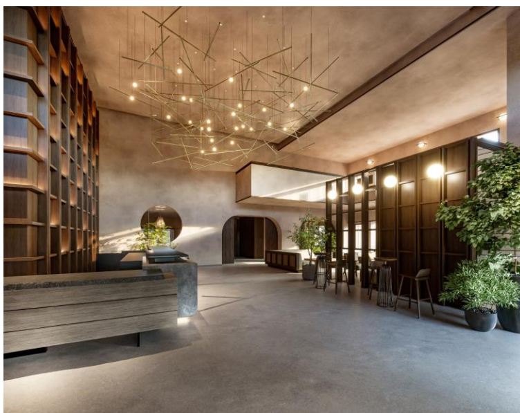
ロビーラウンジイメージ

「nol hakone myojindai」は、当社が1993年に開発した会員制ホテル「東急ハーヴェストクラブ箱根明神平」を改装し、2024年5月に当社ホテルブランド「nol」として、リブランドオープンするリゾート施設となります。人気の観光地箱根の中でも閑静な宮城野エリアの別荘地内に所在し、お客さまが「自分らしく、普段通りに、その地域を楽しめる」ホテルをめざします。なお、予約受付は11月1日（水）より開始いたします。