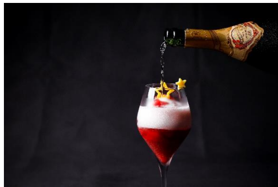
クリスマスカクテル「フレーズノエル」

クリスマスホリデーの3日間限定でご提供する「フレーズノエル」は、たっぷりのフレッシュ苺にカシスリキュールを合わせ、シナモンの風味をプラスしたブランデーベースのフローズンカクテル。仕上げに、エレガントな味わいのシャンパン「デュモアゼル テート・ド・キュヴェ」を注いで完成する一杯です。甘酸っぱい苺の華やかな香りとシャンパンの芳醇なアロマとが調和し、ホリデームードをより一層盛り上げます。水盤に面した幻想的な空間のザバーにて、優雅なひとときをお過ごしください。