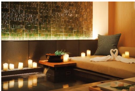
天然温泉付きのペアルーム

「THE ROKU SPA」がお贈りするペアトリートメントプラン「THE ROKU SPA ホリデートリート」では、天然温泉の浴槽をしつらえたペアルームを温かな灯りのキャンドルやタオルアートでデコレートし、クリスマスムードを演出いたします。隣接するしょうざんリゾート京都から湧き出る、弱アルカリ性単純温泉での入浴でゆっくりと身体を温めていただいた後、スイス発のスキンケアブランド Valmont のルミノシティコレクションによるフェイシャルトリートメントでお顔の筋肉の緊張や凝りをほぐし、ふっくらとなめらかな肌へと導きます。全身を温めることで血流を良くし、お肌を柔らかくした後に施術を受けていただくことにより、より高いトリートメント効果が期待できます。また、ご帰宅後のホームケアとして、Valmont のエイジングケアコスメセットをプレゼントいたします。1年間頑張った自分とパートナーへのご褒美SPAをTHE ROKU SPA でご体験ください。