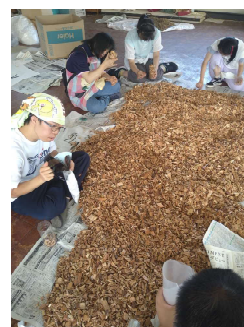
長野県諏訪市 障害福祉サービス事業所「NPO 法人ふおれすと 森の工房あかね舎」での作業風景