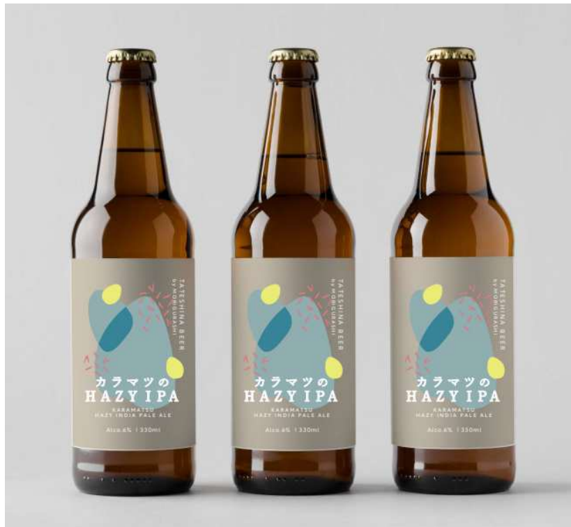
special 「KARAMATSU HAZY INDIA PALE ALE(カラマツの HAZY IPA)」 ショップ/800 円(税込) レストラン/1,100 円 (税込)

蓼科の森で採れたカラマツの爽やかな香りと、松、柑橘類の香り豊かなホップが調和した、ヘイジースタイル※1の IPA (INDIA PALE ALE の略) ※2 です。クラフトビールならではのしっかりとした味わいは、蓼科