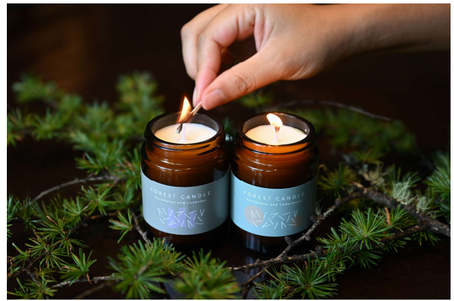
ordinary 「FOREST CANDL (フォレストキャンドル)」 2,000 円(税込)

キャップ付きガラス瓶のため、バスルーム等でも使い勝手が良く、蝋燭が持つ光ゆらぎも癒しを与えてくれるでしょう。蝋燭の小さな炎が優しく香りを広げます。