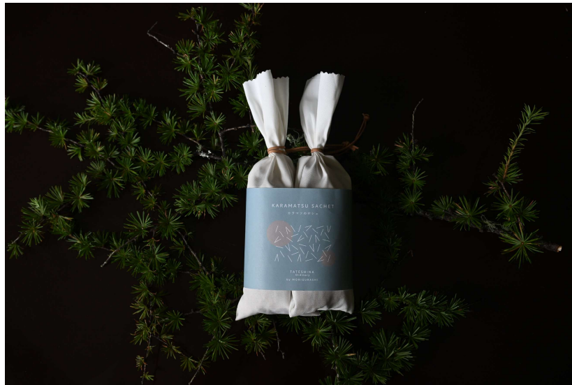
ordinary 「KARAMATSU SACHT (カラマツのサシェ)」 600円 (税込)