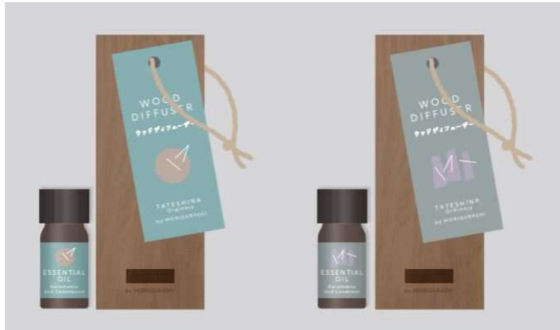
ordinary 「WOOD DIFFUSER (ウッドディフューザー)」 3,800 円(税込)

アロマウッドにカラマツの枝葉から抽出したエッセンシャルオイルを浸透させ、使用します。スティックタイプに比べ、香りが優しく広がり、爽やかな森の中にいる気分になることができる商品です。火や電気等の熱源を使用しないタイプなので、お部屋などで安心してご利用いただけます。