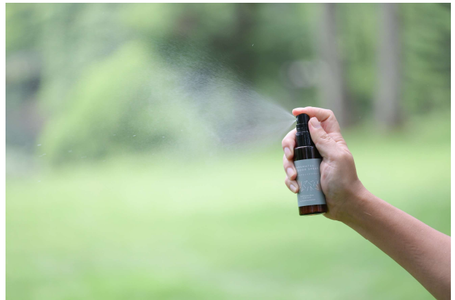
ordinary 「KARAMATSU OUTDOOR SUPRAY (カラマツのアウトドアスプレー)」 1,300 円 (税込)

虫よけの独特な匂いが苦手な方でも、比較的気にならずに使用できる、自然な香りが自慢の商品です。衣類やカーテン、リネン類などの布、または空間に吹きかけて使用します。 ※直接肌に触れても害は有りませんが、布などに吹きかける方が虫よけ効果が期待できます。