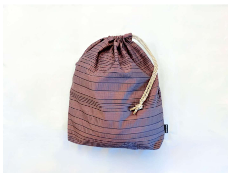
既存カーテン使用