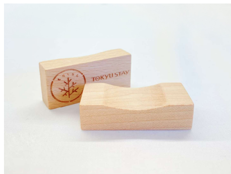
廃棄であった客室の椅子を使用