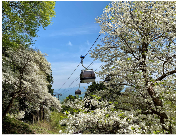
ゴヨウツツジ那須 Gondola ※2023年5月9日（火）撮影

【マウントジーンズ那須 Gondola 公式サイト】 https://www.mtjeans.com/green/