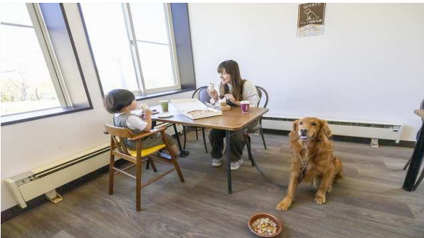
レストラン内は愛犬と一緒に食事が出来るスペース