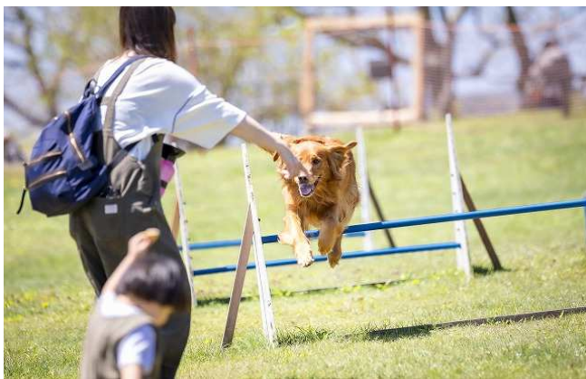
約1,200㎡の広々としたドッグラン完備