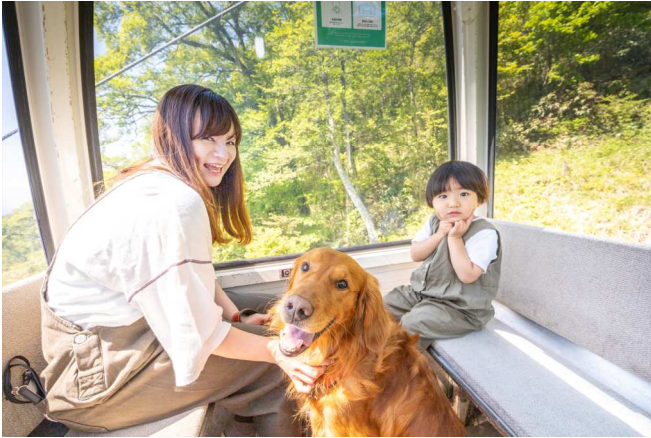
ペット同伴OKの那須ゴンドラ