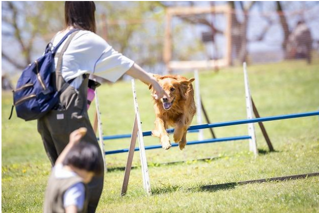
約 1,200 m 2 の天然芝ドッグランを完備

山頂自然広場には、愛犬と一緒に楽しめるエリア「Dog Village」として、約 1,200 m 2 の広々としたドッグランを完備。Dog Village 内にある「山頂カフェ」では、専用のドッグメニューを販売しており、愛犬と一緒に食事をお楽しみいただけます。広場内には、愛犬と撮影を楽しめるフォトスポットも設置しています。山頂自然広場へ向かうゴンドラにはペット同伴で乗車が可能です。ゴンドラはペットゲージなしでご乗車いただけます。施設内はリードのみで移動できる為、ペットゲージの持ち込みも不要です。お連れのペットと一緒に絶景をお楽しみください。